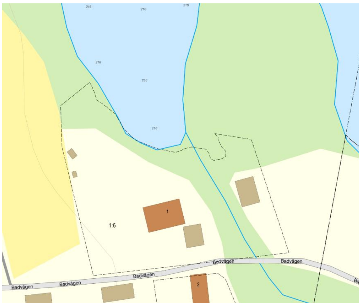
Fastighetskarta 2, vid Forsjöns utlopp där överfallsdamm kommer att placeras på fastigheterna Eksjö Movänta 1:1 och Eksjö Movänta 1:6.